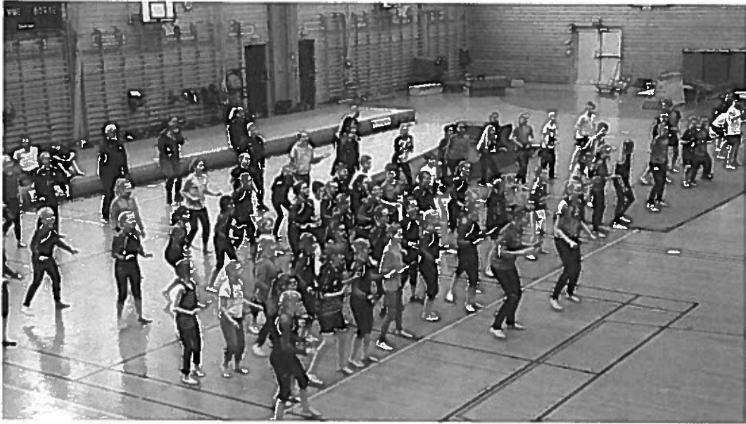
Bilete frå oppvarminga på turndagen 2016.